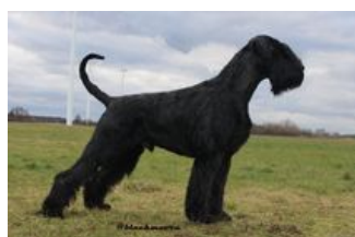
Pontifex Maximus vo... ♂ 21.10.2013 VDH 13RS61012760 BH/VT, AD, IPO 3